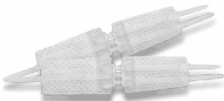
Edge Lock (žaizdos užvėrimo priemonė)