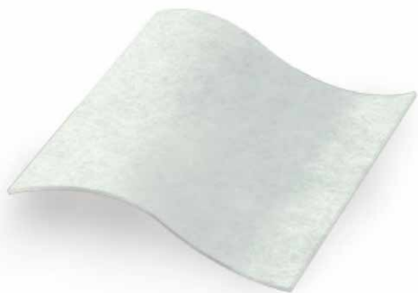
Edge Sorb (karboksimetilceliuliozės tvarstis)

Tvarsčiai ir žaizdos priežiūros priemonės