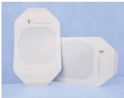
Edge Film (poliuretano pėvelė)