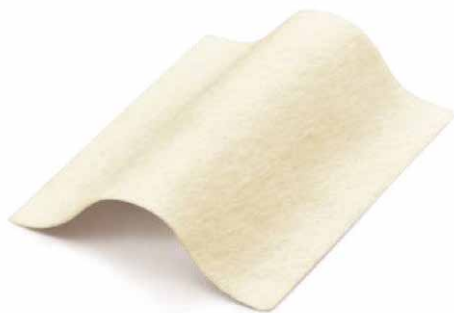
Edge Cel (alginatinis tvarstis)